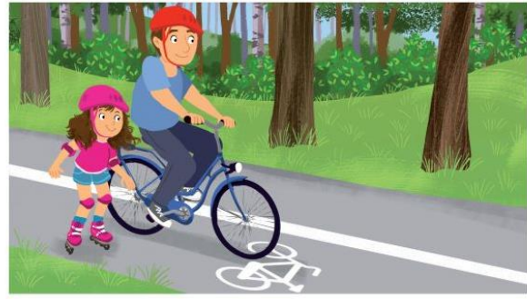
Zakładamy kask i ochraniacze.