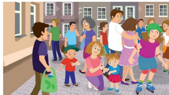
Nosimy opaski identyfikacyjne.