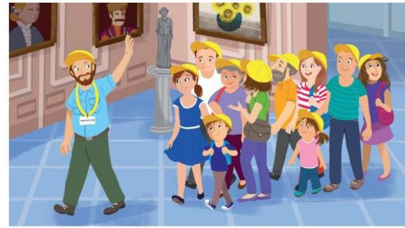
Trzymamy się grupy.