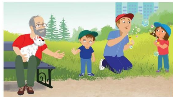
Jesteśmy ostrożni w kontaktach z obcymi.