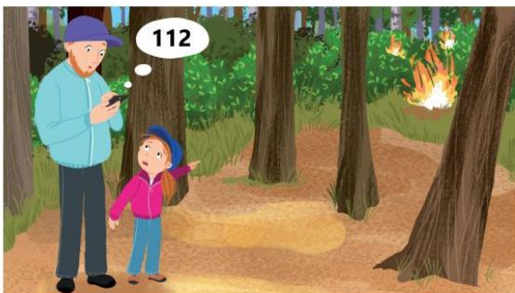
Znamy numer alarmowy.