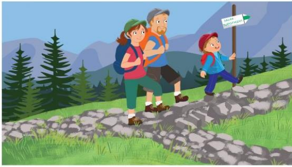
Chodzimy po wyznaczonych szlakach.