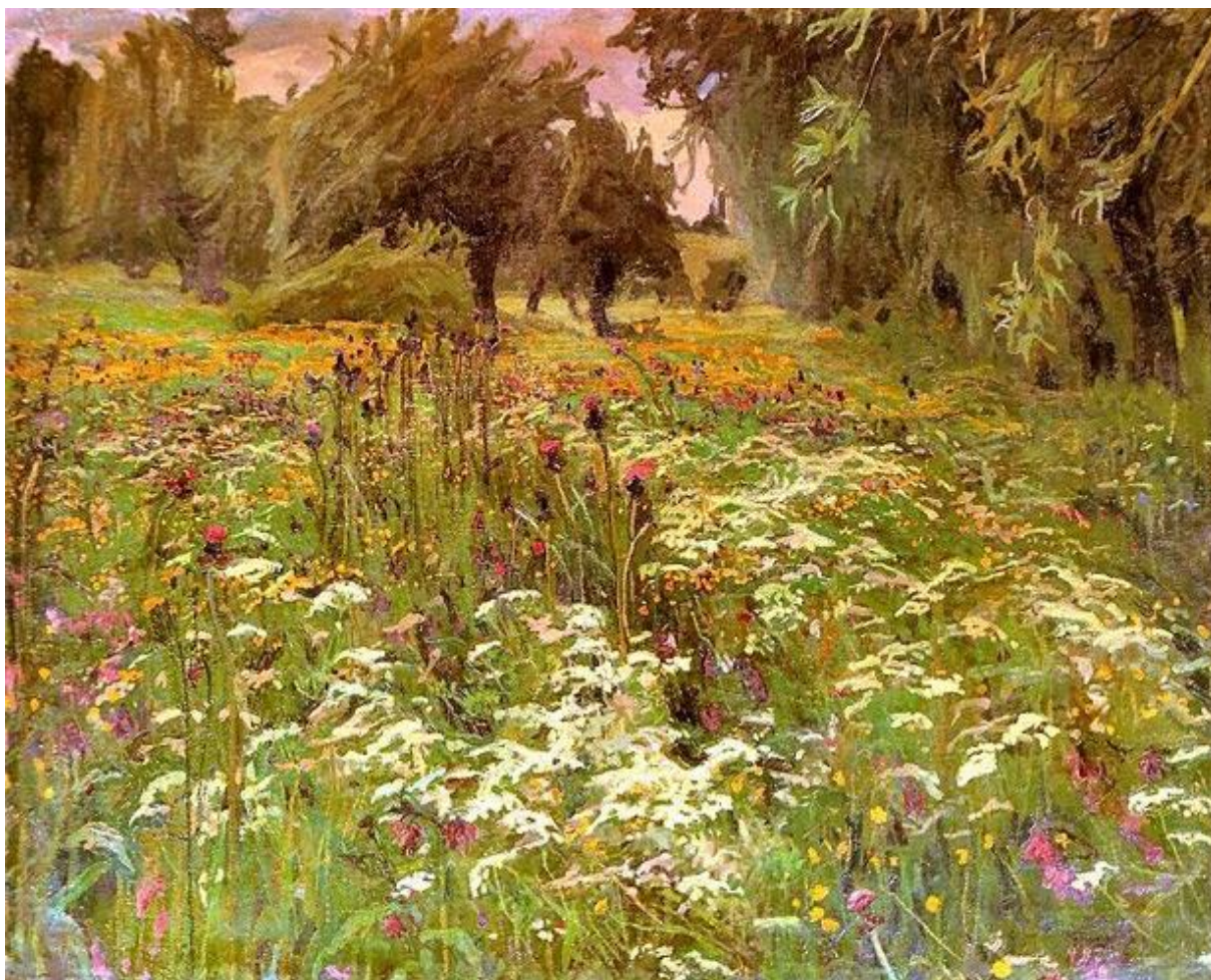
Stanisław Kamocki „Łąka”.