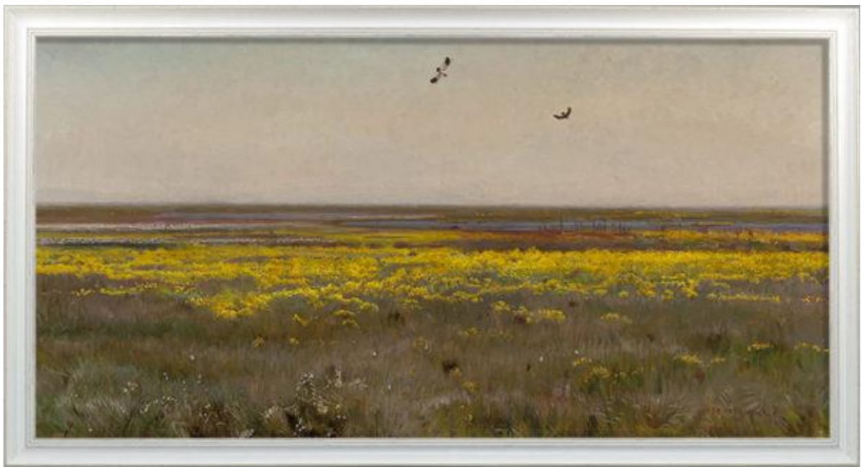
Józef Chełmoński „Kaczeńce”.