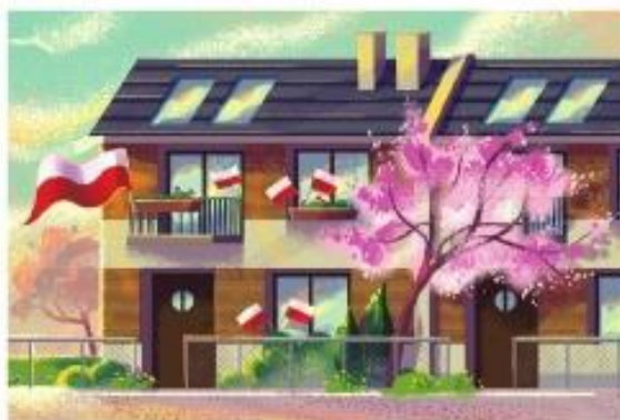
Jak Okazaliśmy Żyć Flagi Rzeczypospolitej Polaków?